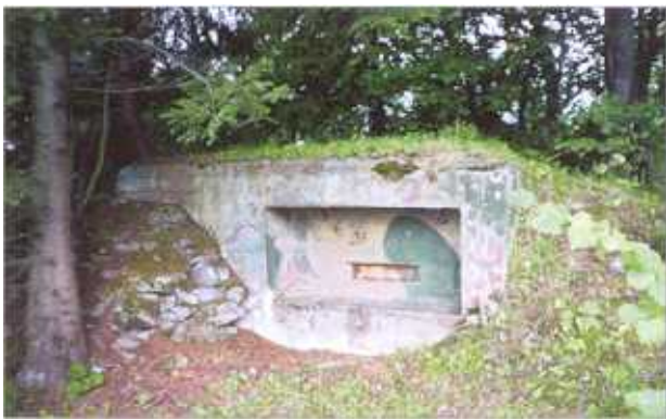
Utrjena topniška opazovalnica na vrhu Rihovega hriba (foto A.J.P.).

(Sperrkompanie Wurtzen/73) na Korenskem sedlu. Ta naj bi se od drugih podobnih utrdb razlikovala