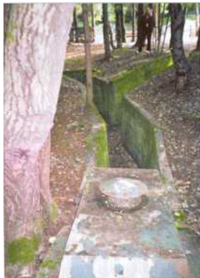
Posamezni deli utrdbе so povezani z odprtimi in pokritimi betonskimi rovi.