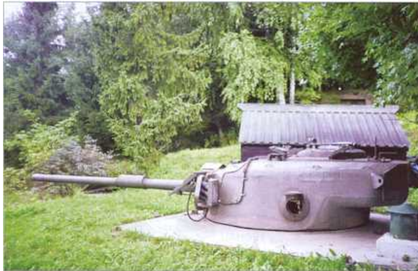
Zgornji od obeh bunkerjev s tankovsko kupolo centurion in zaščitno kolibo.

Leta 1965 so ta utrjeni položaj okrepili z dvema 76-milimetrskima protitankovskima topovoma sovjetske izdelave. Za nadzor njunega ognja so na vrhu hriba zgradili utrjeno opazovalnico. Topova sta ostala tam do leta 1989. Leta 1986 pa so zgradili oba bunkerja, ki sta zdaj največja zanimivost muzeja. Gre za bunkerja s tankovskima kupolama centurion, ki sta oboroženi s 105-milimetrskima protitankovskima topoma. Postavili so ju na južno pobočje in v vsakega od njiju vgradili 156 kubičnih metrov betona. Obe kupoli so maskirali z lesenima kočama, ki sta bili povezani čeznjo in ju nista le skrivali, ampak tudi varovali pred vremenskimi vplivi. Sistem namestitve in odstranjevanja teh maskirnih kolib je bil nadvse preprost: šest vojakov jo je dvignilo in prestavilo. Vendar je v svoji glavni smeri top lahko deloval še tako, da so po sistemu garažnih vrat odprli čelno stranico kolibe. Poleg dejanskih bunkerjev s kupolami sta zdaj na ogled tudi dve lažni kupoli oziroma maketi, kakršne so razmeščali na lažne položaje, da bi z njimi zavledli nasprotnika, pa tudi nekaj tankovskih kupol, pripeljanih z drugih opuščeni utrdb.