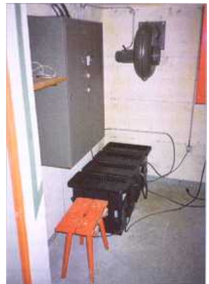
Notranjost utrdbe: prezračevalnik in akumulatorji (foto A.J.P.).

Do leta 1997, ko so jo dejansko prenehali uporabljati, so utrdbo razširili prav do vrha vzpetine. Tam, kjer se vrh prevesi v severozahodno pobočje, utrdbo končuje pet odprtih mitraljeških položajev. Ti naj bi zaustavili morebiten pehotni napad,