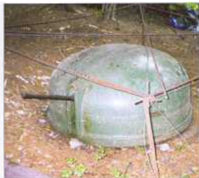
Bunker z jekleno kupolo, v kateri je težki mitraljez browning, ki naj bi utrdbо varoval pred letali in helikopterji, je najstarejši del utrdbе na Korenskem sedlu.