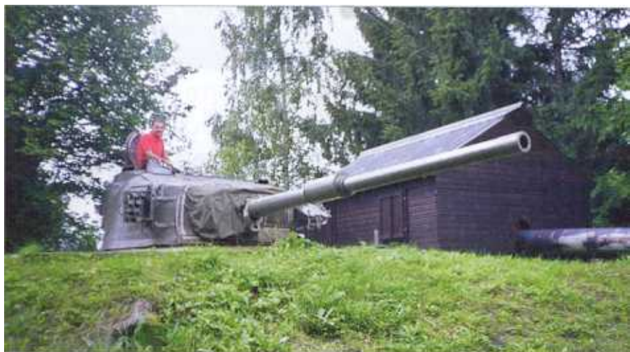
Spodnji od obeh bunkerjev s tankovsko kupolo centurion, ob njem zaščitna koliba

T ega, da so v okvirih hladne vojne zanimivi kot prehodno ozemlje, so se zavedali tudi sami Avstrijci in njihova vojska kljub nevtralnosti nikoli ni bila zanemarljiva. Čeprav se ni nikoli spopadla z resnično neposredno grožnjo, je imela prave priliko za preizkus svoje opera-