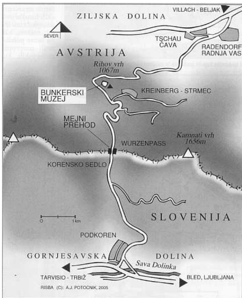
Lokacija nekdanje utrdbe, zdaj Bunkerskega muzeja na Korenskem sedlu (risba A.J.P.)

tivne sposobnosti v operacijah zaščite meja med madžarsko vstajo leta 1956, zatrtjem praške pomladi leta 1968 in med slovensko vojno za neodvisnost. Ta pri nas dokaj slabo znana operacija zaščite meja je bila – gledano z našega zornega kota – sicer povsem nepotrebna, vendar velja kot zadnja doslej pri sosedih za najzanimivejšo, odkar so leta 1955 vzpostavili zdajšnjo zvezno vojsko Bundesheer.