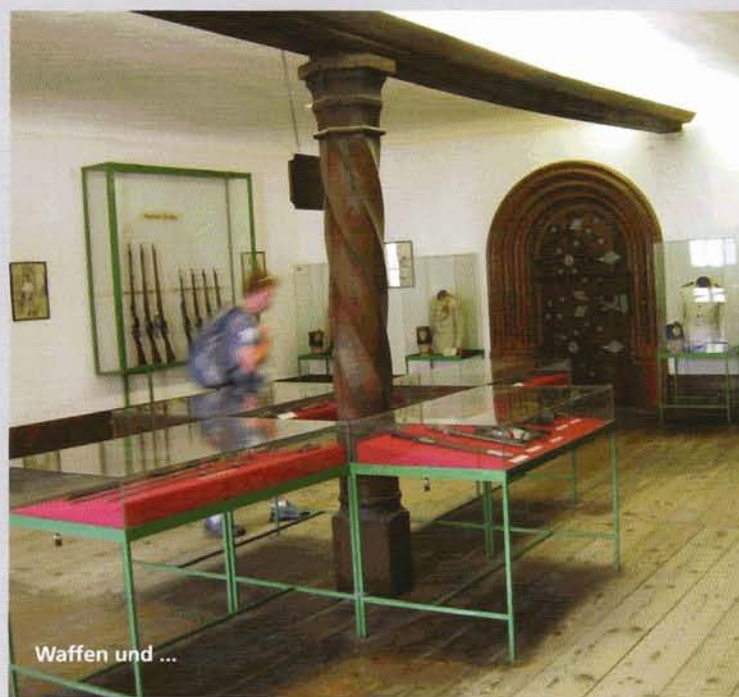
Waffen und ...

Der Museumsshop des „Rainer-Museums“ bietet praktisch nur zwei Bücher stark rechtslastiger Autoren bzw. Verlage und einen Katalog zur derzeit laufenden Sonderausstellung über den Ersten Weltkrieg in Tirol. Letztgenannter ist es übrigens zu danken, dass der Besucher der Ausstellung im Moment wenigstens ein bisschen über das historische Umfeld des Infanterieregimentes „Erzherzog Rainer“ informiert wird.