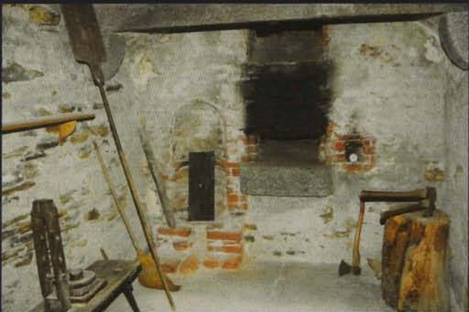
Die Festung Nauders – architektonisch sehenswert oben rechts: Uniformen von Kaiserjägern und -schützen mitte: Puch Haflinger des Bundesheeres unten: Die Festungsküche