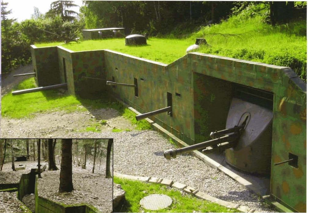
Bunkermuseum Wurzenpass: Die 2009 errichtete Schaubefestigungsanlage mit sog. Schartewaffen. Kleines Bild: das originale Stellungssystem mit Kampfdeckungen

Ein Museum – das wahrscheinlich bedeutendste zu einem moderneren wehrgeschichtlichen Thema im Westen und Süden Österreichs – fehlt in diesem Reigen derzeit allerdings: Das Kaiserjägermuseum in Innsbruck . Es soll nach einem großen Umbau erst im Februar 2011 wieder eröffnet werden. Das Kaiserjägermuseum wird an das neu errichtete Bergisel-Museum mit dem Bergiselschlacht-Riesenrundgemälde von Zeno Diemer „angedockt“ werden. Laut Konzept soll es allerdings weitgehend in seiner früheren Aufstellung erhalten bleiben und sozusagen das „Museum eines Museums“ darstellen. Verantwortlich für die Ausrichtung zeichnet das Tiroler Landesmuseum Ferdinandeum. Wie weit diese Konzeption verwirklicht und ob sie eine Chance oder ein Fluch für das Kaiserjägermuseum sein wird, wird sich erst in etwas mehr als einem halben Jahr zeigen.