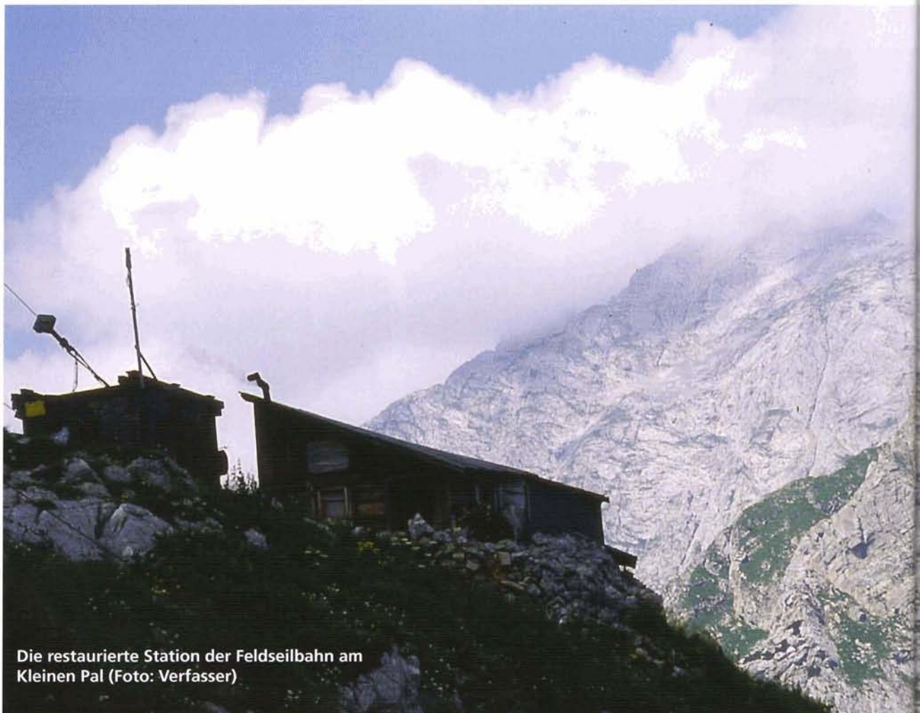
Die restaurierte Station der Feldseilbahn am Kleinen Pal

bis zum Wurzenpass. Ihre Tauglichkeit mussten weder das Raumverteidigungskonzept noch die festen Anlagen je unter Beweis stellen. Auch wenn die Sperranlagen am Wurzen zuletzt während des Jugoslawien-Konfliktes 1991 in Verteidigungsbereitschaft versetzt worden waren.