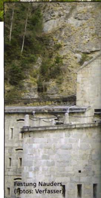
Festung Nauders