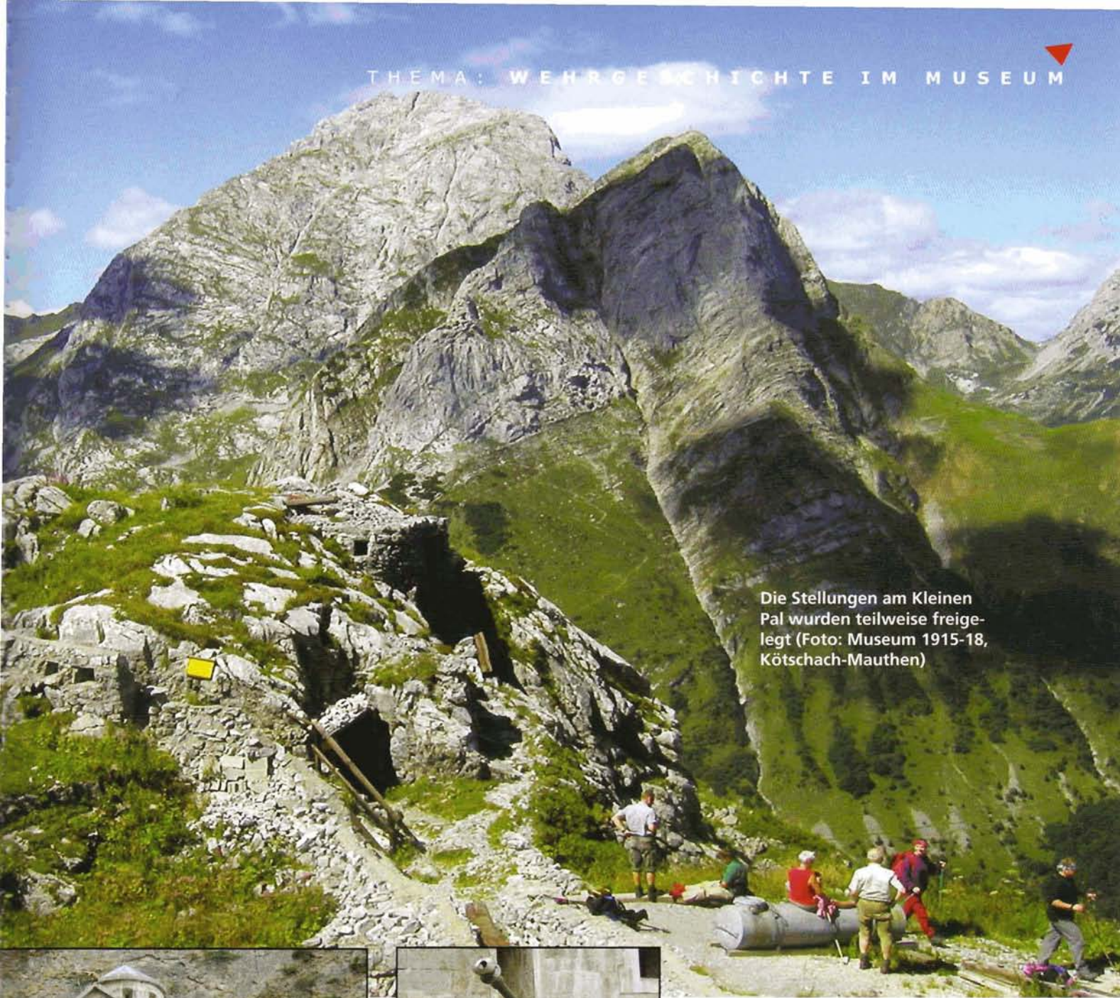
Die Stellungen am Kleinen Pal wurden teilweise freigelegt