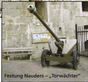
Festung Nauders – „Torwächter“

Festungstechnisch war Nauders schon nach wenigen Jahrzehnten völlig veraltet. Was wegen des wenig exponierten Standortes aber keine Rolle spielte. Dieser Tatsache, dass Nauders weit weg von allen Fronten war, verdankt die Festung auch heute noch ihren (jedenfalls äußerlich)