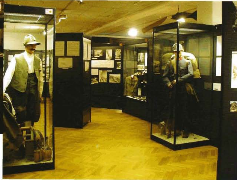
Italienische und österreichische Uniformen in Kötschach-Mauten

Wer über etwas Bergerfahrung verfügt, sollte aber keinesfalls den Freilichtteil auslassen. Erst wer die beklemmenden Stellungen am Kleinen Pal in oft unwirtlicher Natur mit eigenen Augen gesehen hat, kann wenigstens etwas das Wesen des Gebirgskrieges von 1915–1918 verstehen. Ganz erfassen kann man ohnedies nie, wie Menschen unter diesen primitiven und in jeder Hinsicht lebensfeindlichen Bedingungen jahrelang gelebt und gekämpft haben.