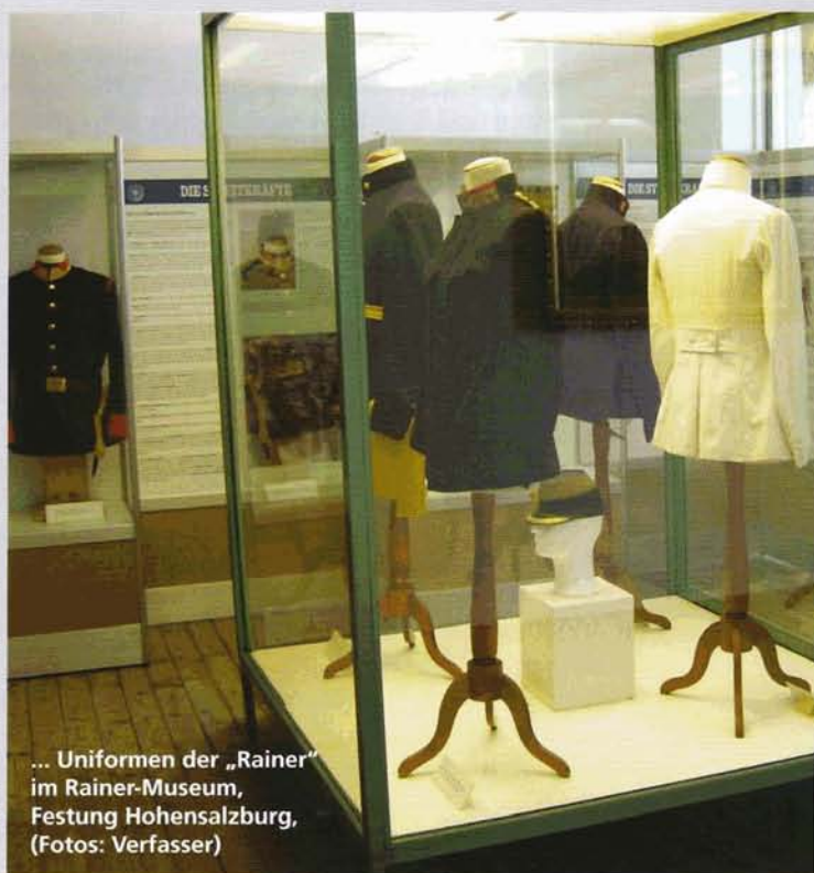
... Uniformen der „Rainer“ im Rainer-Museum, Festung Hohensalzburg, (Fotos: Verfasser)