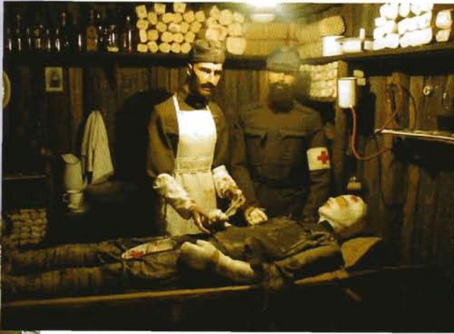
Darstellung eines Verbandsplatzes im Museum 1915-18, Kötschach-Mauten