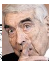
Helmut Zilk wollte die Modernisierung

Darüber hinaus muss das Bundesheer im Inland weiterhin die Luftraumüberwa-