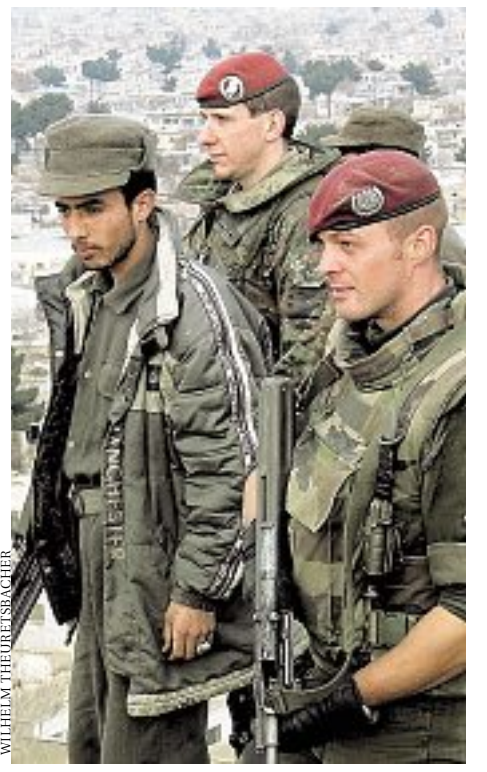
Österreichische Soldaten flankieren einen Krieger der Nordallianz in der afghanischen Hauptstadt Kabul. Kein Politiker und kein Militär hatte vor dem Jahr 1991 mit weltweiten und gleichzeitig sehr gefährlichen Einsätzen gerechnet