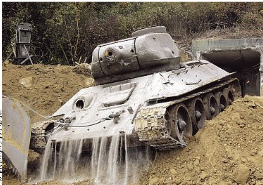
Abbau: Mit Ende des Kalten Krieges wurden nicht nur Bunker demontiert, sondern auch Teile der Heeres