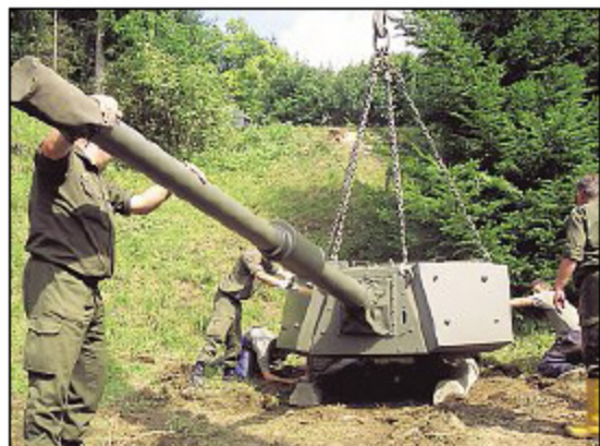
Das Heer half beim Aufbau des Bunkermuseums